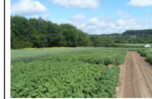
Comportarea agronomică VCU: anii 3 și 4