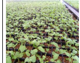
Repicarea de plantule în seră : anul 0