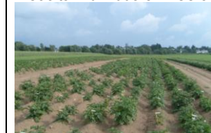
Plantarea în câmp, 2 tuberculi/clonă: anul 1