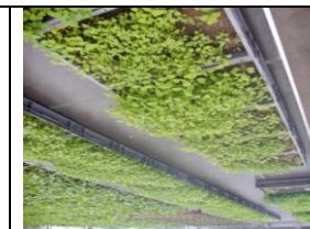
Semănatul semințelor în seră : anul 0