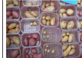
Recolta individuală în seră: anul 0